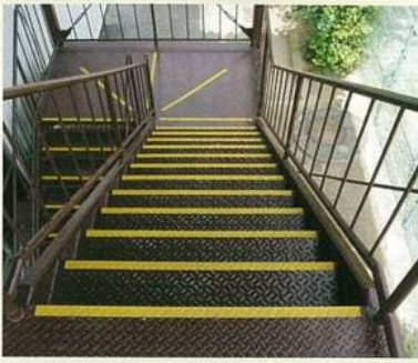
●鉄板やコンクリートの階段に...