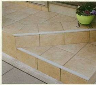
●玄関アプローチのタイル地に...